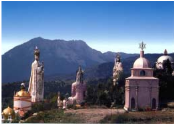
Cité Sainte de MANDAROM - France