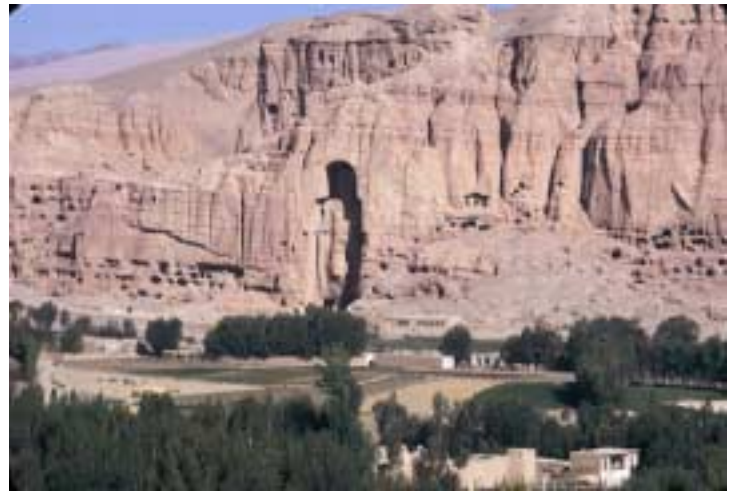
Les BOUDDHAS de BAMİYAN – Afghanistan